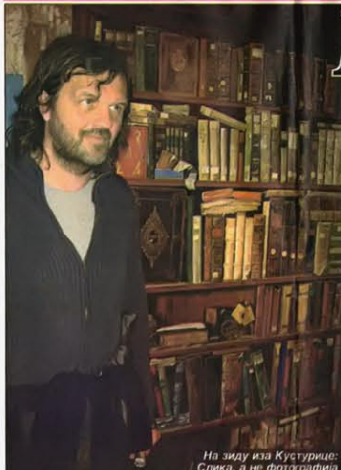
На зиду иза Кустурице: слика, а не фотографија

У КУСТУРИЧИНОМ ДРВЕНГРАДУ ПОСТАВКЕ СЛИКА ПОСЈЕЂЕНИЈЕ НЕГО У РЕНОМИРАНИМ ИЗЛОЖБЕНИМ ПРОСТОРИМА